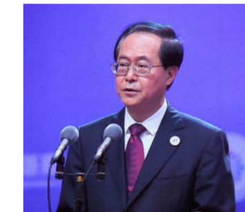
浙江省委书记车俊寄语浙商

本届大会以“聚力高质量、共筑中国梦”为主题，坚持“创业创新闻天下、合心合力强浙江”宗旨，共安排29场活动，签约项目共计124个，协议总投资超过3000亿元，系历届之最。开幕式现场举办了“高质量发展”领军企业表彰仪式，颁发2019全球浙商金奖，并开通浙江为侨服务全球通平台、浙江省金融综合服务平台、浙江省企业服务综合平台，展现浙江省委、省政府深入推进“最多跑一次”改革，打造国际一流营商环境，全面关爱浙商、服务浙商、助力浙商的鲜明态度和具体举措。