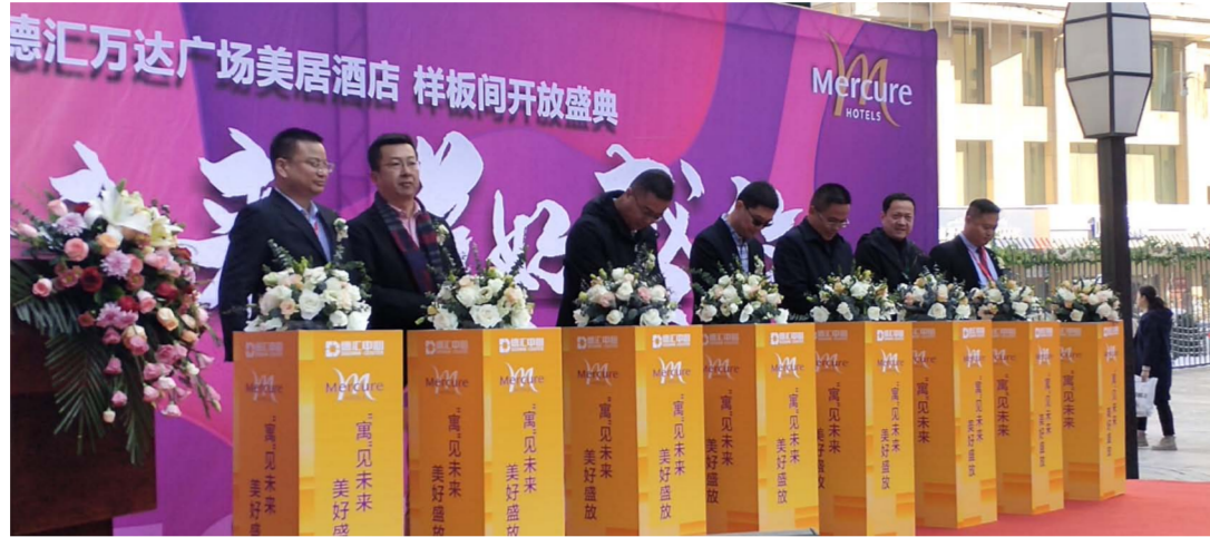
▲ 德汇中心美居酒店盛大启幕

此次落户的德汇万达广场美居酒店，是美居在乌鲁木齐市与德汇集团合作的旗舰店项目，更优质的资源服务、高品质管理将贯穿整个项目的落地和建成，既秉承了法国雅高集团美居品牌国际四星酒