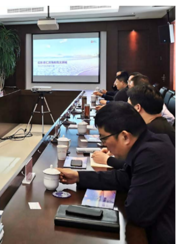
▲ 德汇集团高管向启东市委做项目专题汇报

余德华副市长表示已通过规委会的原概念方案，具有相应法律效力，建议稳中求进，优先推进 K12 国际学校，同时预留大学建设用地；增强文旅与康养产业策划；积极与自然资源局与财政局研究土地出让协议。他强调