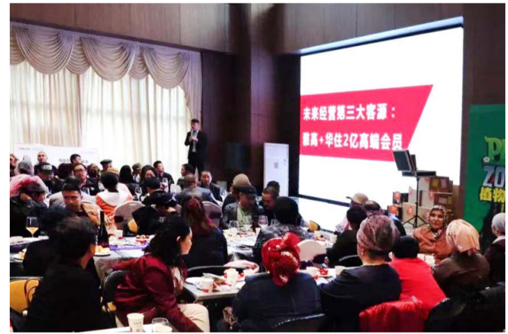
▲ 当天活动现场宾客云集