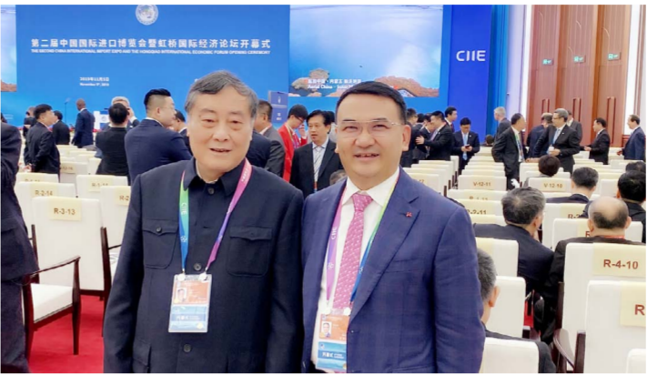
▲ 钱金耐董事长与娃哈哈集团创始人宗庆后在进博会开幕式上合影

（上接第一版）习近平总书记连续两年出席中国国际进口博览会开幕式发表主旨演讲，充分体现了中国政府的高度重视，体现了中国支持多边贸易体制、推动贸易自由化、便利化的一贯立场，让人看到了中国推动建设开放型世界经济、构建人类命运共同体的实际行动。