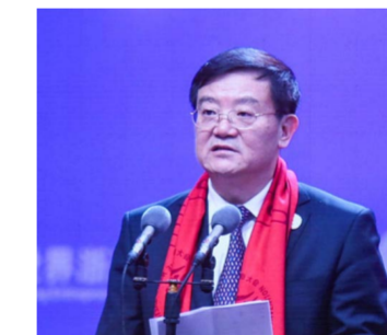
全国工商联党组书记徐乐江致辞