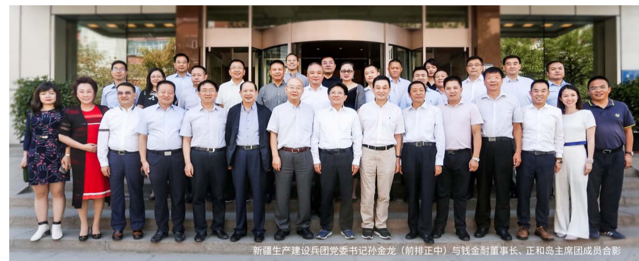
新疆生产建设兵团党委书记孙金龙(前排正中)与钱金耐董事长、正和岛主席团成员合影

8月11—13日，受正和岛新疆岛邻机构主席、德汇集团董事长钱金耐的邀请，正和岛创始人兼首席构架师刘东华率核心主席团成员一行20余人，走进新疆考察调研，旨