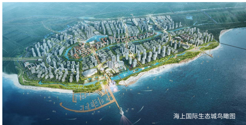
海上国际生态城鸟瞰图

德汇中心集中精力做好ZARA、优衣库、无印良品、丝芙兰、迪卡侬、星巴克、海底捞、HM等3-5个主力品牌引进，同时做好的对万达的服务监督管控。德汇中心近学北汇嘉，远学西安赛格，做好顶层设计大有可为。