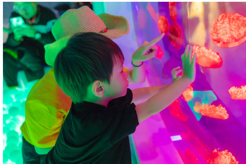
▲小朋友们开心的与萌宠互动

除动物园常规受众群——亲子家庭之外，“萌宠乐园”受众群范围更广。凭借增设拍照打卡点、全园设