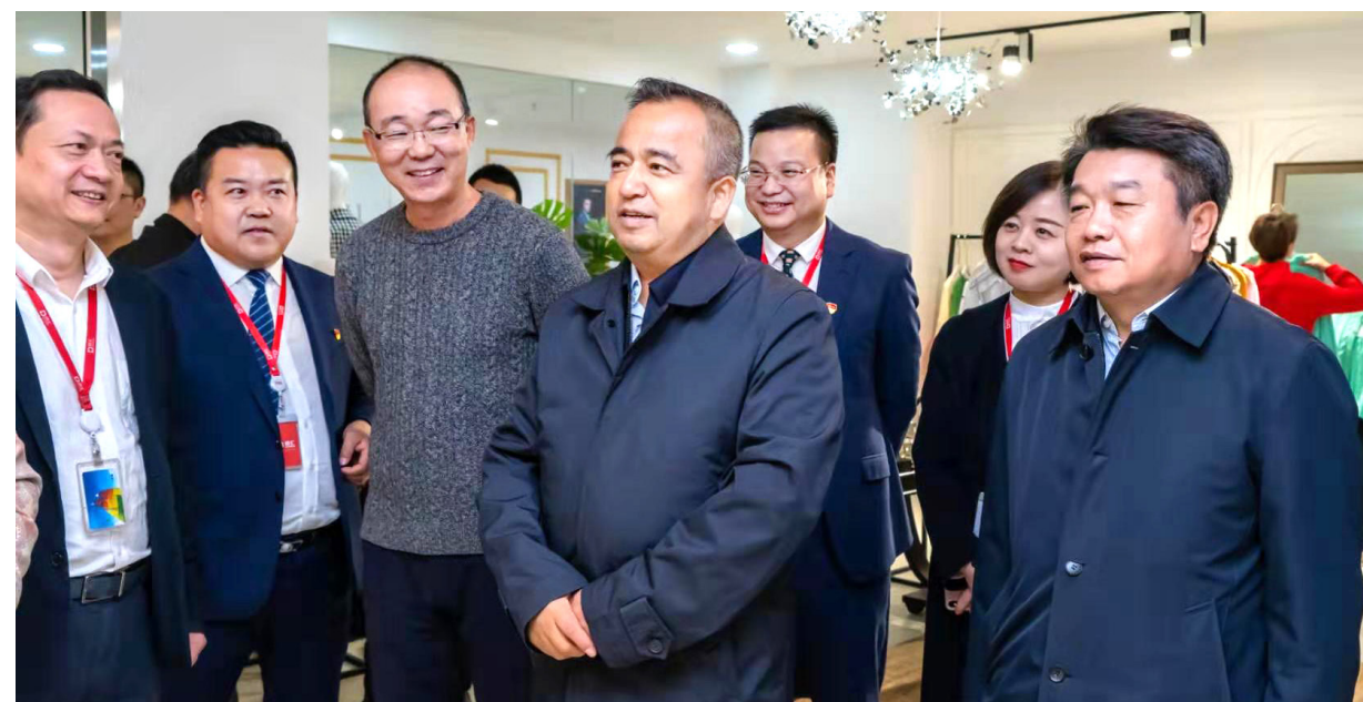
▲ 自治区党委常委艾尔肯·吐尼亚孜(前排中)一行考察德汇中心

为进一步拓宽联系民营企业沟通渠道,促进非公有制经济健康,加强对民营企业家的政治引领,10月18日新疆自治区党委常委、自治区副主席艾尔肯·吐尼亚孜莅临德汇中心考察,自治区商务厅副厅长解俊杰、自治区工商联秘书长田刚等陪同调研。德汇集团党委书记李艳玲,党委副书记、常务副总裁王健,副总