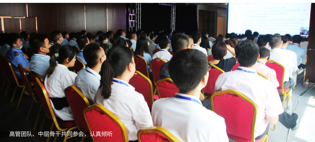
高管团队、中层骨干共同参会，认真倾听

酒店公司、物流园、百思百广场、大宗贸易公司、监察审计部、财务中心、法务部、信息部、企管部负责人立足本部门运营情况，做了关于上半年总结及下半年工作计划的报告，进一步提出了对各部门重点工作的执行方案。