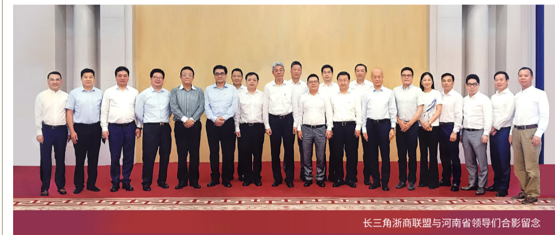
长三角浙商联盟与河南省领导们合影留念

7月29日-30日，为深入学习贯彻习近平总书记在企业座谈会上的重要讲话精神，考察浙江重要讲话精神，集聚浙商资源，拓展浙商发展新空间，助推河南经济社会高质量发展，“知名浙商走进郑州”活动成功举行。